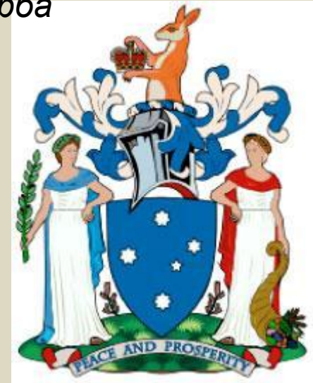
Полное изображение герба

Созвездие Южного Креста (одна звезда восьмиконечная, две семиконечных, одна шестиконечная и одна пятиконечная). Вверху — кенгуру с имперской короной. Девиз: «Мир и процветание».