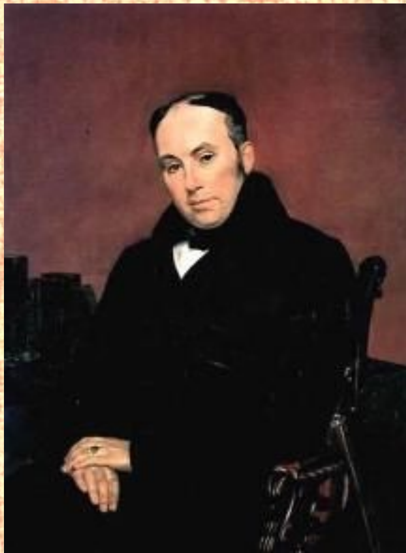
Портрет В.А. Жуковского, 1838 г.