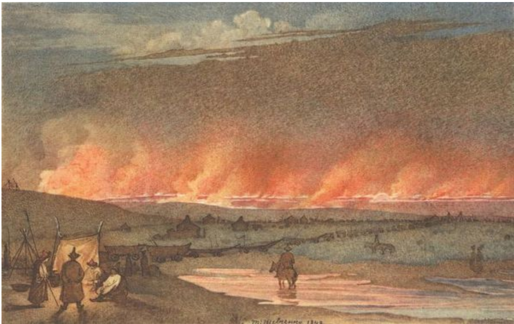
Пожар в степи. 1848 год