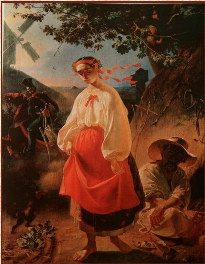
Катерина. 1840 год

«... Есть на свете доля, А кто её знает? Есть на свете воля, Где ж она гуляет? Есть на люди на свете- В золоте сияют, Кажется, богаты, А доли не знают- Ни доли, ни воли! С бедой породнятся- Жупан надевают, А плакать стыдятся, Так берите ж золото, Богачами станьте, А горькие слезы Для меня оставьте. Затоплю недолю Горькими слезами Затопчу неволю Босыми ногами! Тогда я и весел, Богат и доволен, Когда моё сердце Забьется на воле!» (1938 г.)