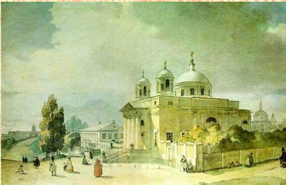
Костел в Киеве. 1846 год

В мае 1843 года Шевченко выезжал на Украину, где провёл около года. Вернувшись в Петербург и окончив Петербургскую Академию художеств весной 1845 года он получив звание "некласного (свободного) художника" вернулся на Украину, намереваясь поселиться в Киеве. В это время он работал художником в Киевской археологической комиссии, много путешествовал по Украине, писал и рисовал.