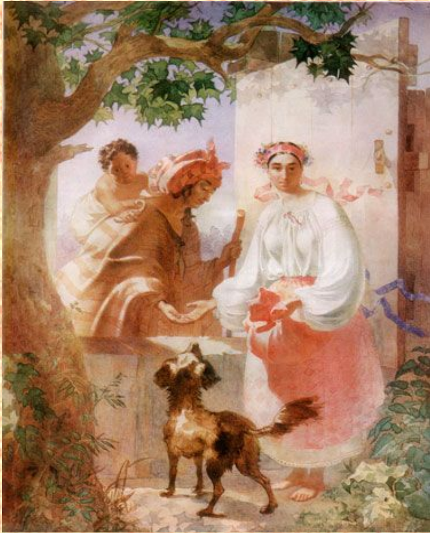
Цыганка- ворожка, 1840 г.

В том же, 1838 году Тарас Шевченко поступил в Академию Художеств, где стал учеником и товарищем К.П. Брюллова. Уже за жанровые композиции 1840 года («Мальчик –нищий, дающий хлеб собаке» и «Цыганка-гадалка») Шевченко был удостоен серебрянной медали второй степени. В годы учебы в Академии художеств он создал целый ряд своих известных произведений, среди которых «Автопортрет», «Катерина», «Крестьянская семья», многочисленные рисунки, а также автоиллюстрации и иллюстрации к произведениям Пушкина, Квитко-Основьяненко, Надеждина, Гоголя и Шекспира.