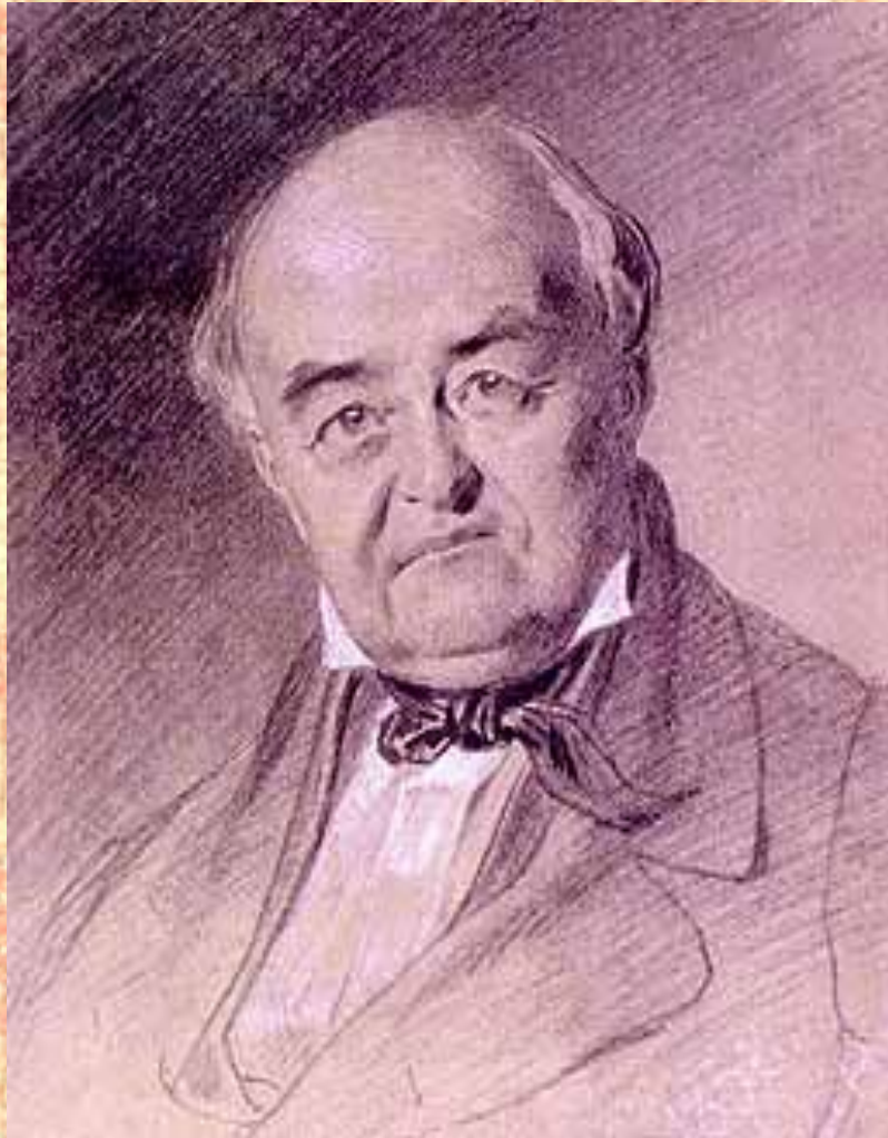
Портрет М.С. Щепкина работы Т. Шевченко, 1857 г.

Шевченко и Щепкин знали друг о друге задолго до личного знакомства, которое произошло, по видимому, в 1844 г. в Москве. Посвященное Щепкину стихотворение "Заворожи мені, волхве", написанное 13 декабря 1844, свидетельствует о том, что уже тогда между ними установилась сердечная близость. На протяжении многих лет дружба эта несла в себе глубокую идейную, творческую, человеческую близость гения поэзии и гения сцены.