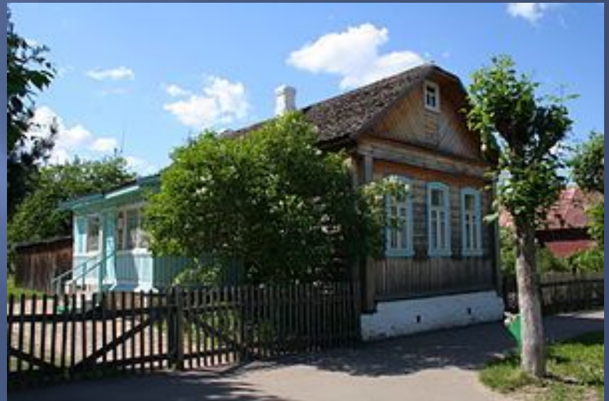
Дом Гагарина в школьные годы

24 мая 1945 года семья Гагариных переехала в Гжатск. В мае 1949 года Гагарин окончил шестой класс Гжатской средней школы, и 30 сентября поступил в Люберецкое ремесленное училище № 10. Одновременно поступил в вечернюю школу рабочей молодёжи, седьмой класс которой окончил в мае 1951 года, а в июне окончил с отличием училище по специальности формовщик-литейщик.