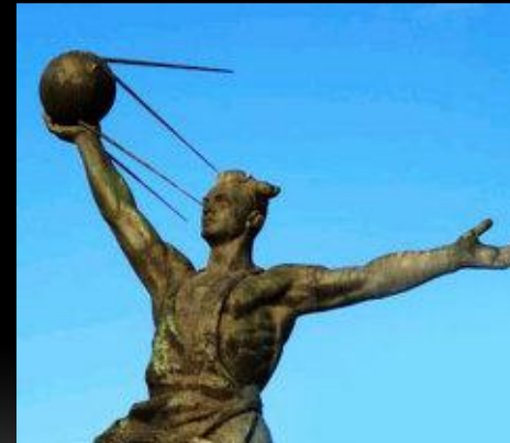
Памятник конструкторам первого искусственного спутника Земли