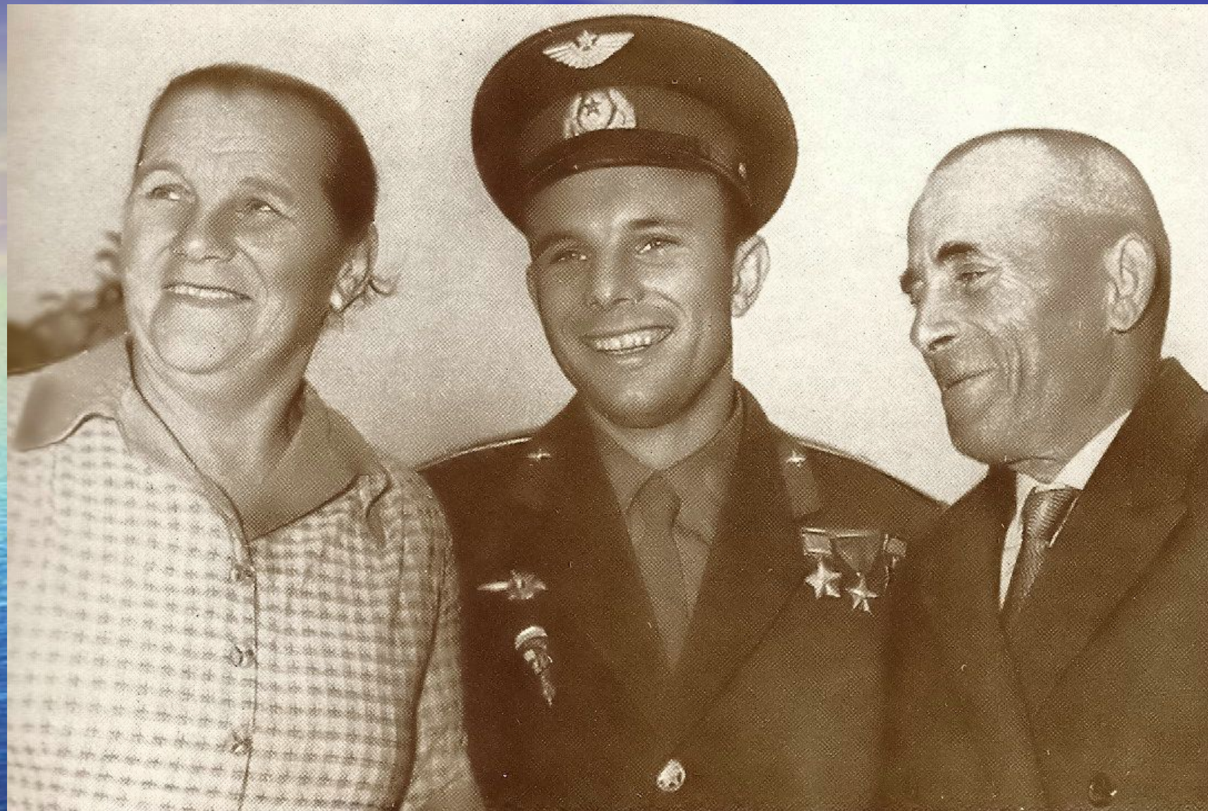
РОДИТЕЛИ ЮРИЯ ГАГАРИНА – АННА ТИМОФЕЕВНА И АЛЕКСЕЙ ИВАНОВИЧ