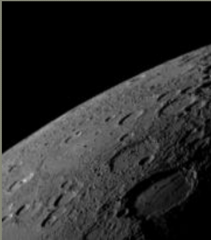
Поверхность напоминает лунную (снимок MESSENGER)

Поверхность Меркурия во многом напоминает лунную — она усеяна множеством кратеров. Плотность кратеров различна на разных участках. Предполагается, что более густо усеянные кратерами участки являются более древними, а менее густо усеянные — более молодыми, образовавшимися при затоплении лавой старой поверхности. В то же время, крупные кратеры встречаются на Меркурии реже, чем на Луне. Самый большой кратер на Меркурии назван в честь великого немецкого композитора Бетховена , его поперечник составляет 625 км. Однако сходство неполное — на Меркурии видны образования, которые на Луне не встречаются. Важным различием гористых ландшафтов Меркурия и Луны является присутствие на Меркурии многочисленных зубчатых откосов, простирающихся на сотни километров — эскарпов. Изучение их структуры показало, что они образовались при сжатии, сопровождавшем остывание планеты, в результате которого поверхность Меркурия уменьшилась на 1%. Наличие на поверхности Меркурия хорошо сохранившихся больших кратеров говорит о том, что в течение последних 3—4 миллиардов лет там не происходило в широких масштабах движение участков коры, а также отсутствовала эрозия поверхности, последнее почти полностью исключает возможность существования в истории Меркурия сколько-нибудь существенной атмосферы.