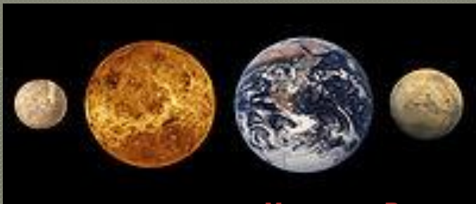
Сравнительные размеры Меркурия, Венеры, Земли и Марса

Меркурий — самая маленькая планета земной группы. Его радиус составляет всего 2439,7 \pm 1,0 км, что меньше радиуса спутника Юпитера Ганимеда и спутника Сатурна Титана . Масса планеты равна 3,3 \times 10^{23} кг. Средняя плотность Меркурия довольно велика — 5,43 г/см 3 , что лишь незначительно меньше плотности Земли . Учитывая, что Земля больше по размерам, значение плотности Меркурия указывает на повышенное содержание в его недрах металлов. Ускорение свободного падения на Меркурии равно 3,70 м/с 2 . Вторая космическая скорость — 4,3 км/с.