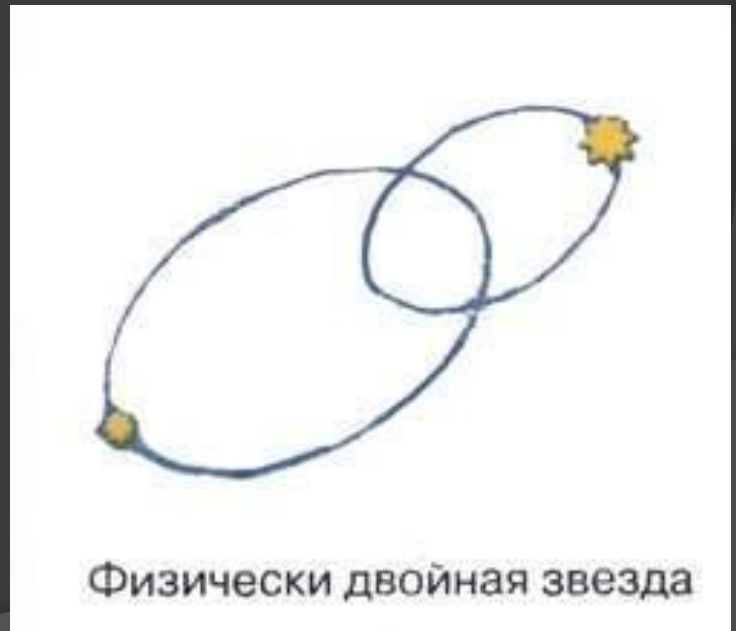
Физически двойная звезда