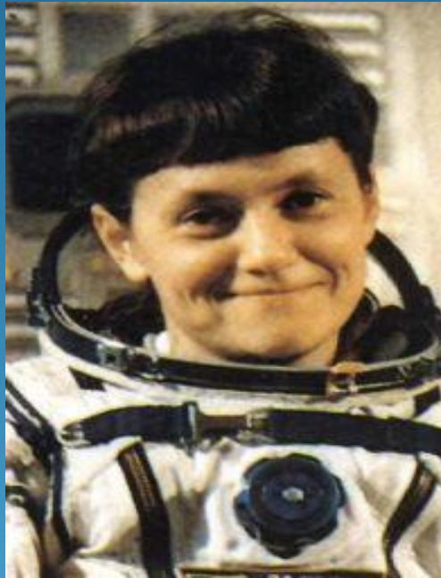
Савицкая Светлана Евгеньевна