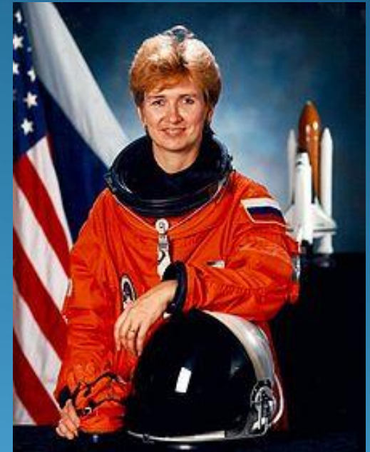
Кондакова Елена Владимировна