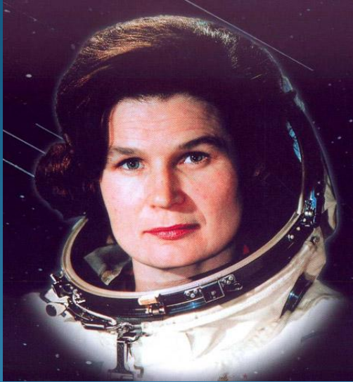
Валентина Владимировна Терешкова