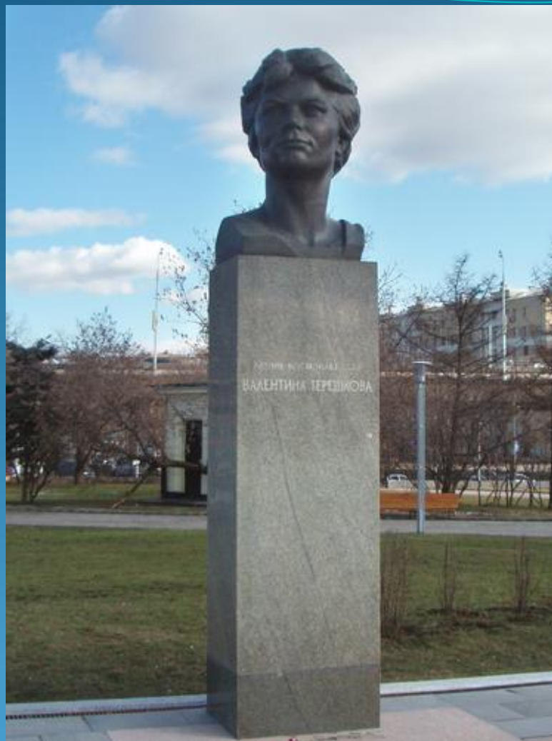
Памятник Валентине Терешковой в Москве