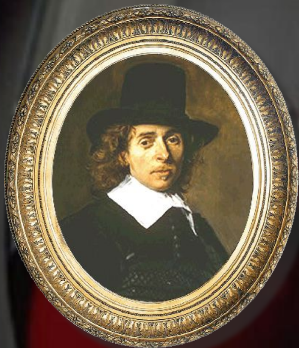
Андриан ван Остаде Голландия, XVII век