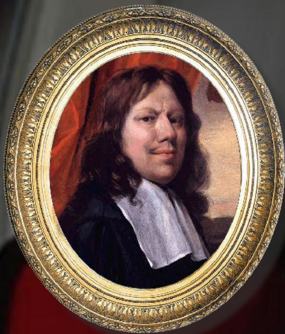
Ян Стен Голландия, XVII век