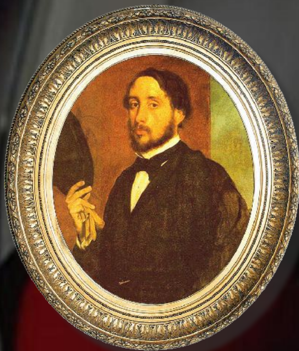
Эдгар Дега Франция, XVIII век