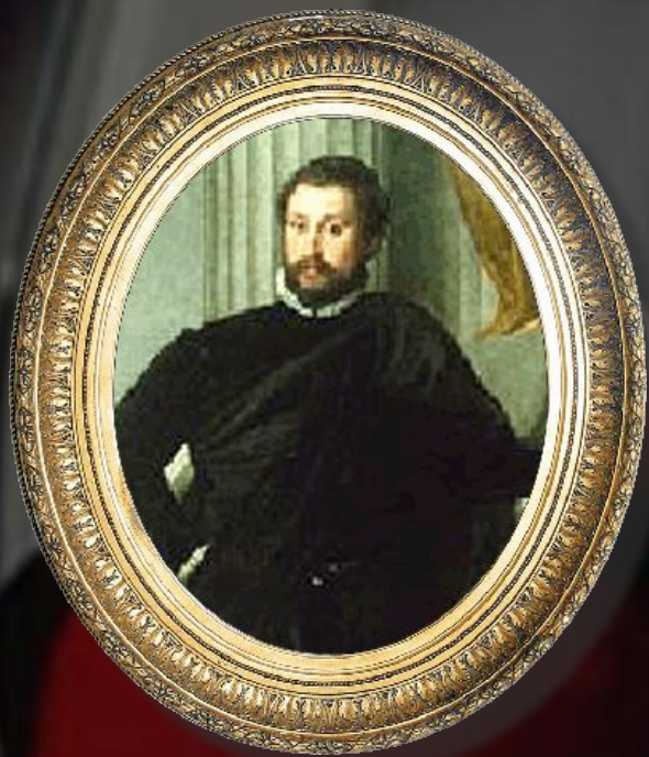
Паоло Веронезе Возрождение, XV век