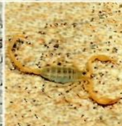
Смерингуру с скорпион