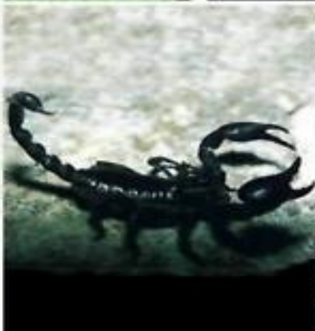
Саблевидны й скорпион