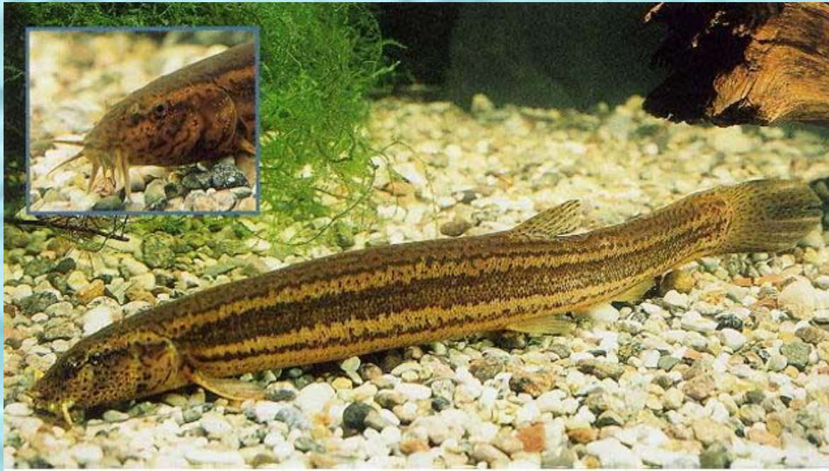
Вьюн - Misgurnus fossilis