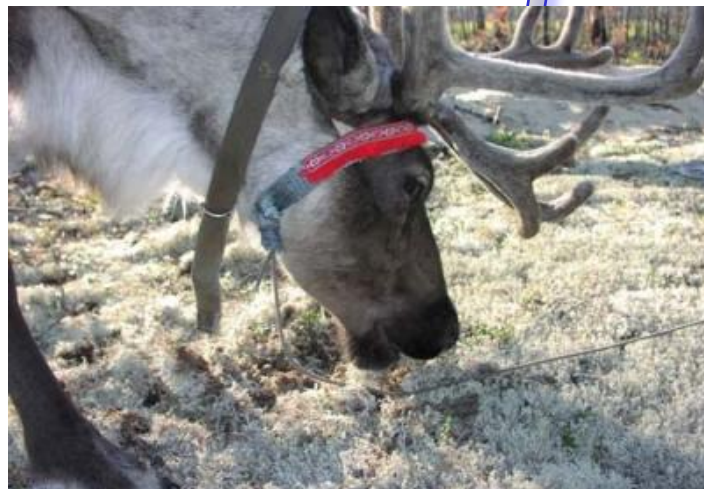
↓ пастбища для оленей