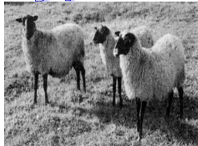
↓ пастбища для овец и верблюдов