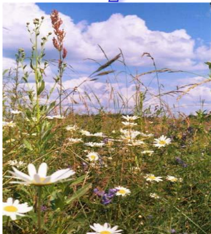
↓ луговые травы