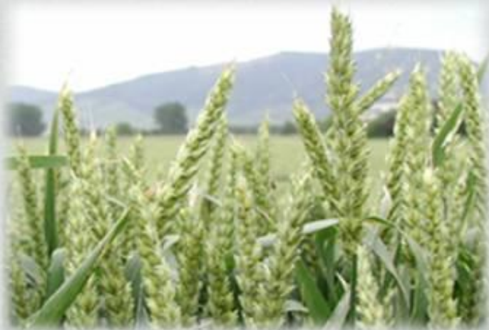
пшеница – самоопыляющееся растение

При создании сортов пшеницы применяют индивидуальный отбор