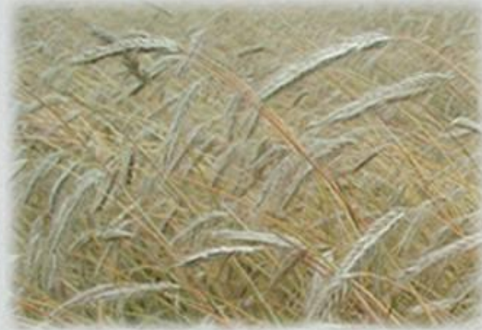
рожь – перекрестно опыляющееся растение

При создании сортов пшеницы применяют индивидуальный отбор