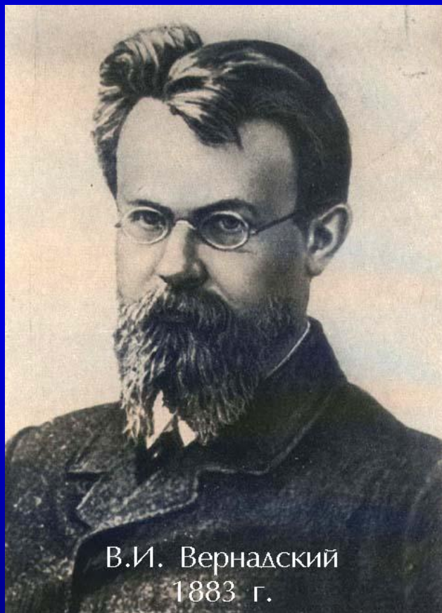
В.И. Вернадский 1883 г.