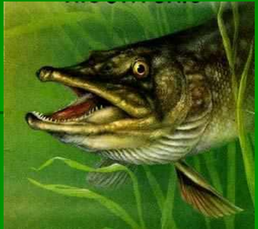
щ у к а