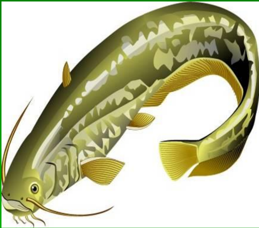
с о м