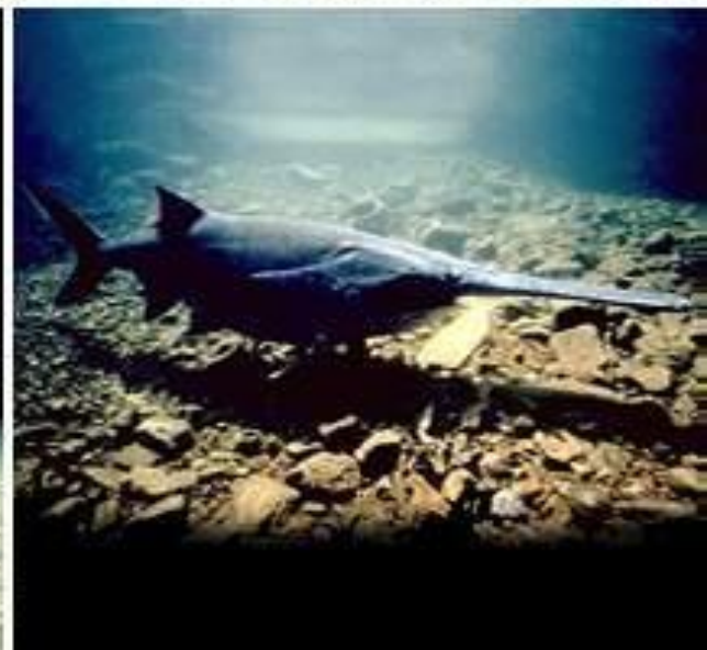
Осетрообразные. Верхний ряд, слева направо: белуга, сибирский осётр, стерлядь. Нижний ряд, слева направо: севрюга, обыкновенный лопатонос, веслонос.