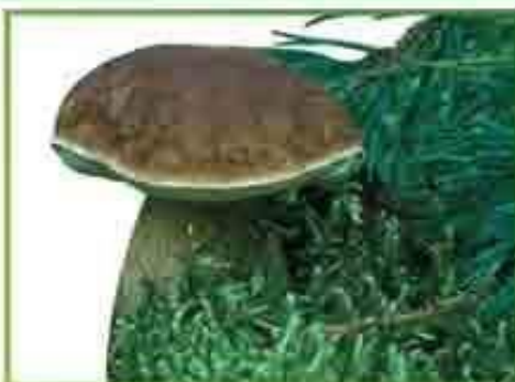
белый гриб (сосновый)