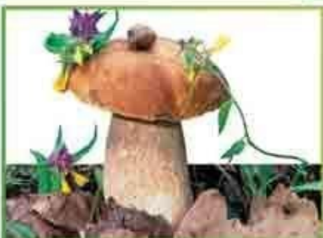
белый гриб (еловый)