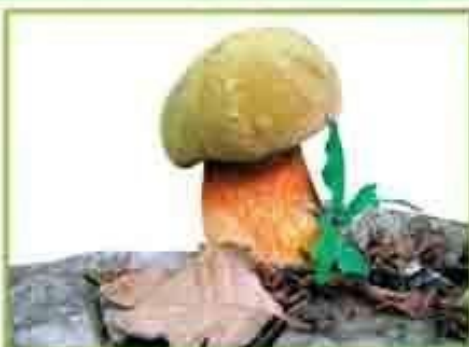
белый гриб (дубовый)