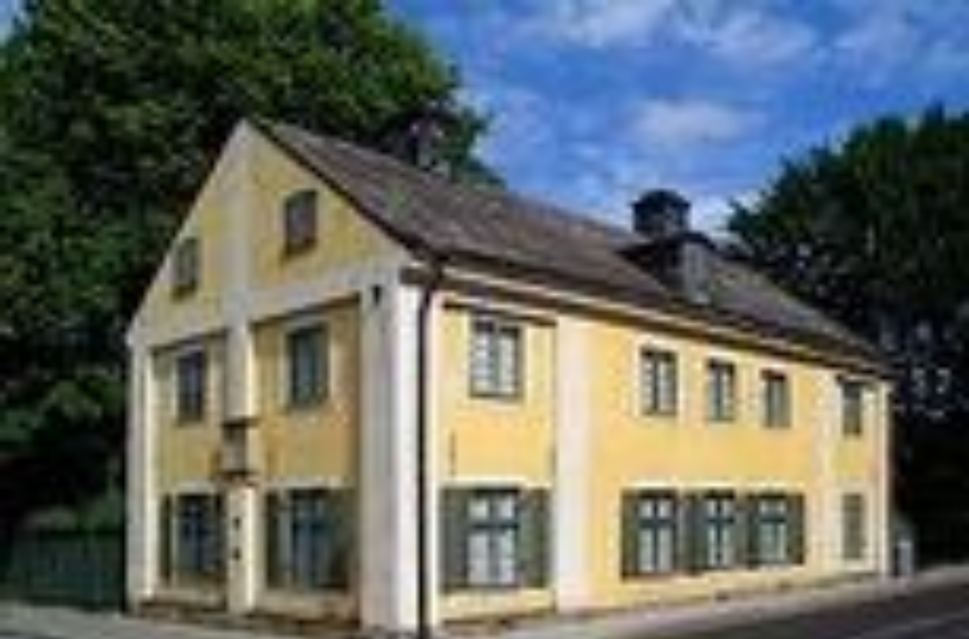
Уппсаладағы Линней үйі.