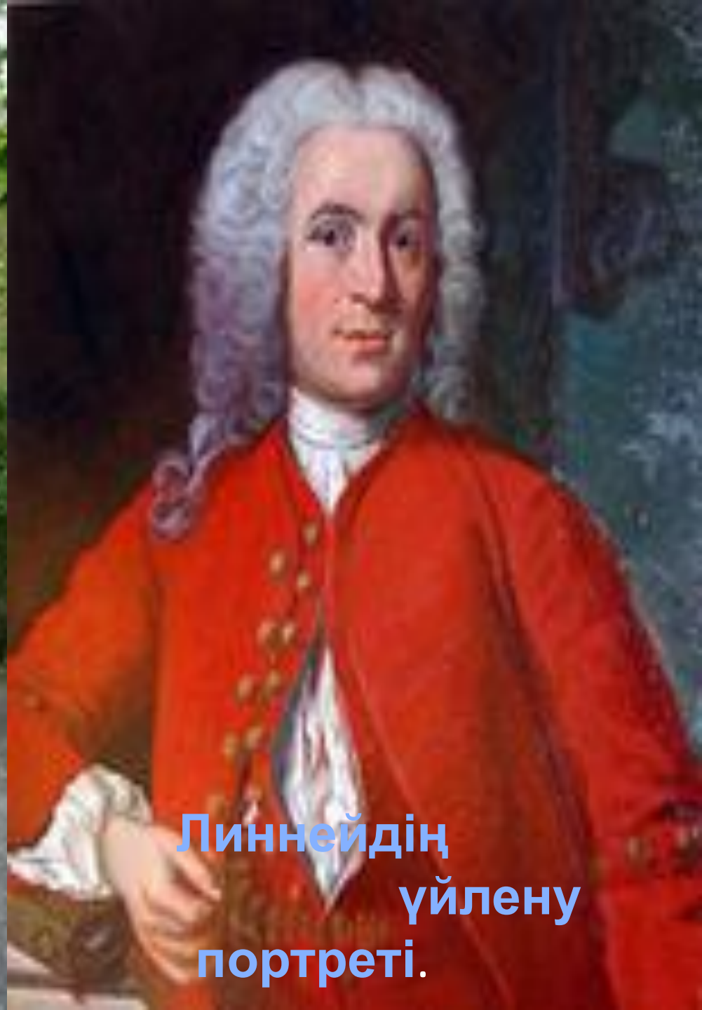
Линнейдің үйлену портреті.