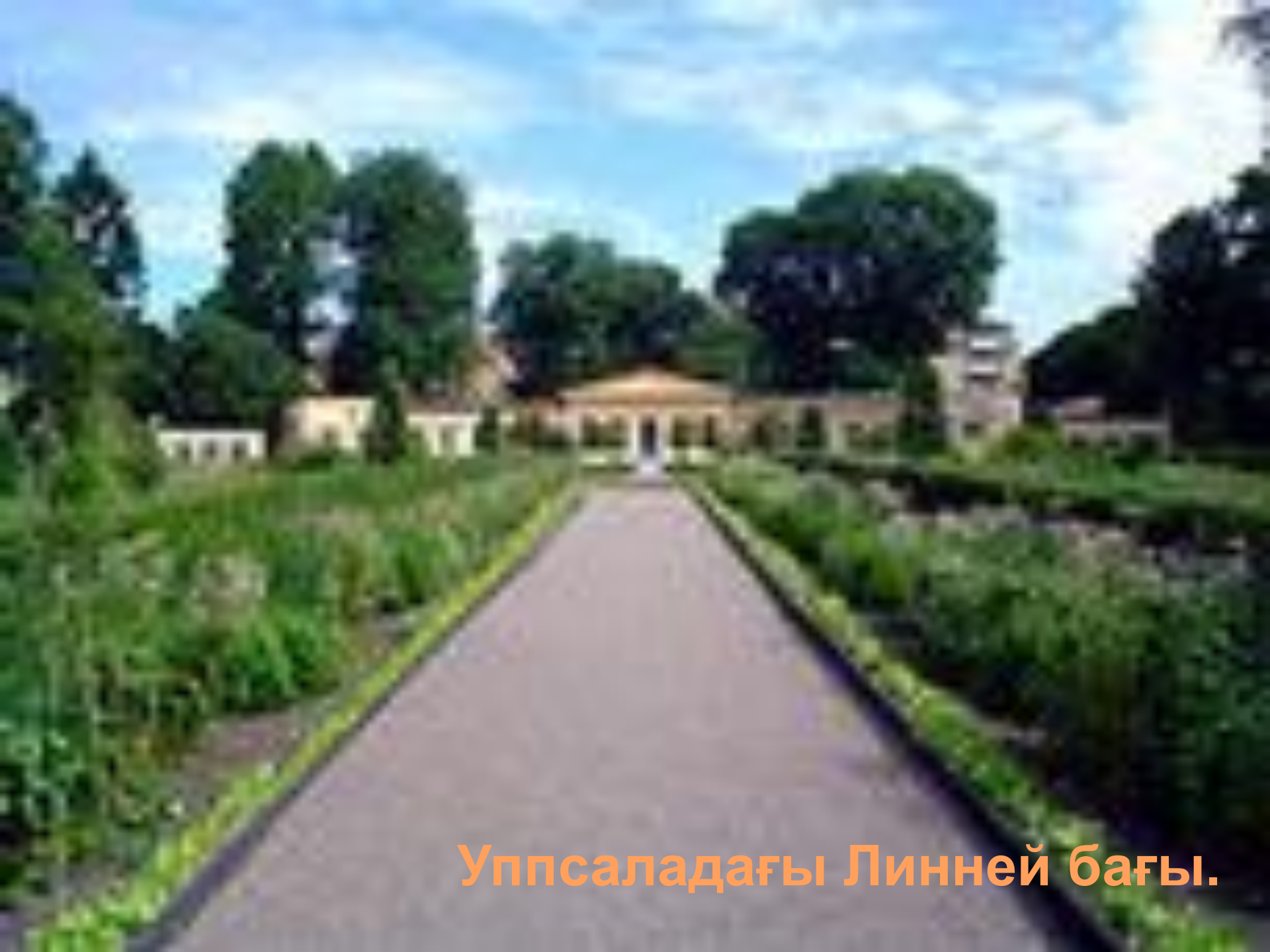
Уппсаладағы Линней бағы.