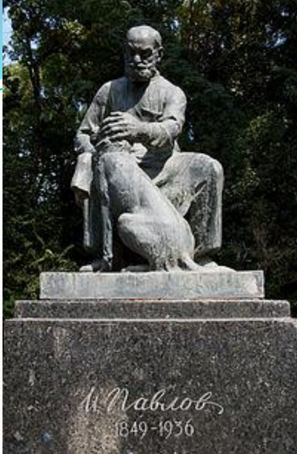
Памятник И. П. Павлову в городе Сухуми