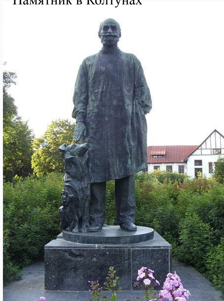
Памятник в Колтунах