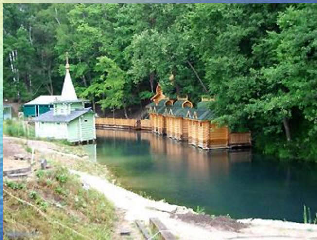
Святой источник преподобного Серафима Саровского

Источник – естественный выход подземных вод на земную поверхность.