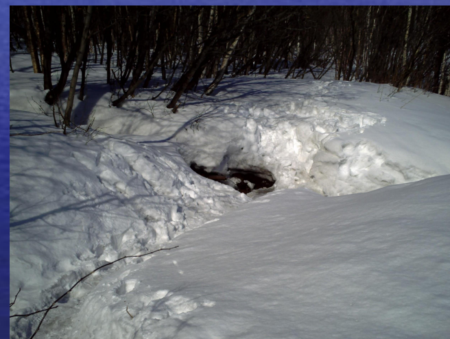
СВЯТОЙ ИСТОЧНИК п. Майский