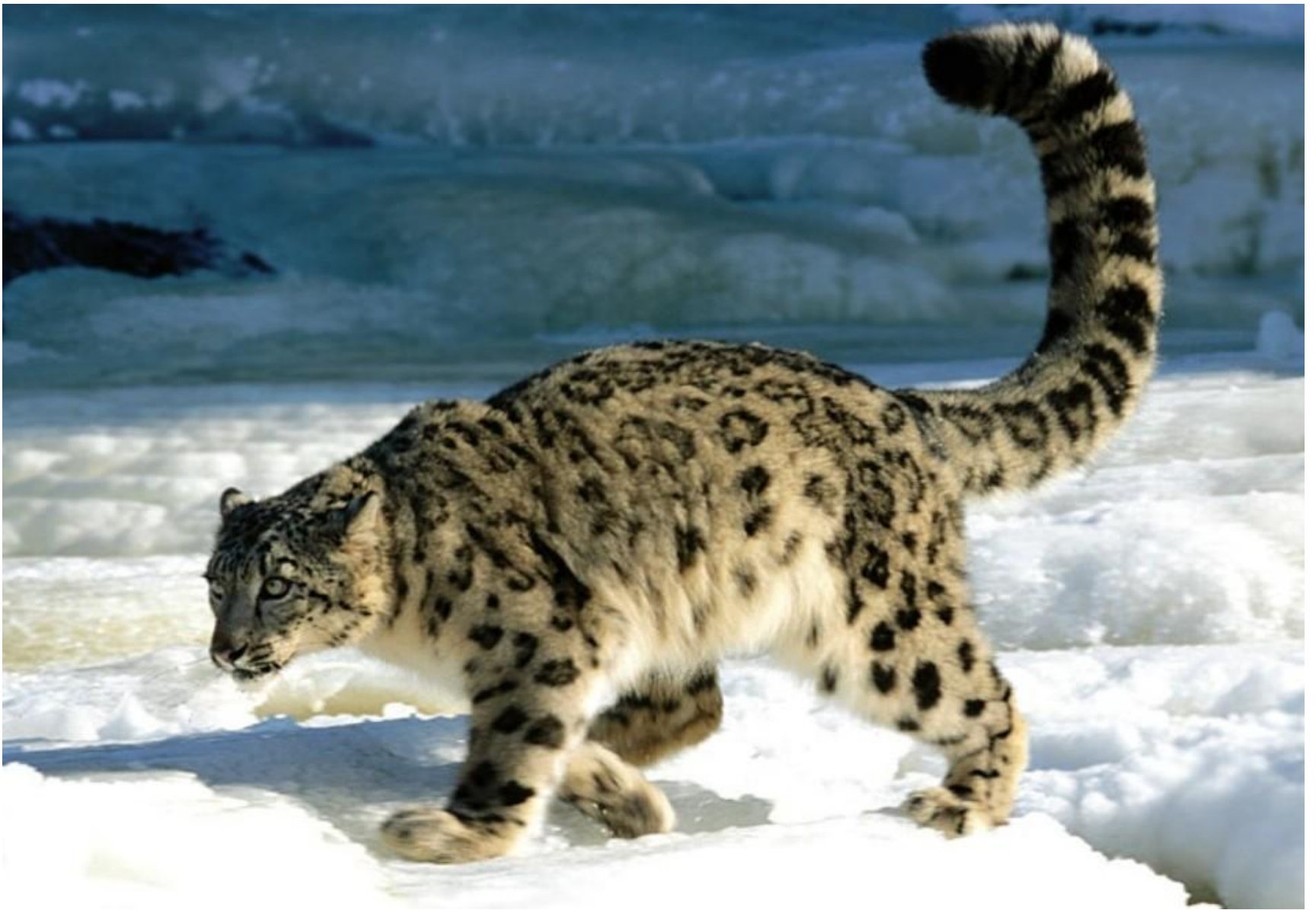
ирбис (снежный барс)