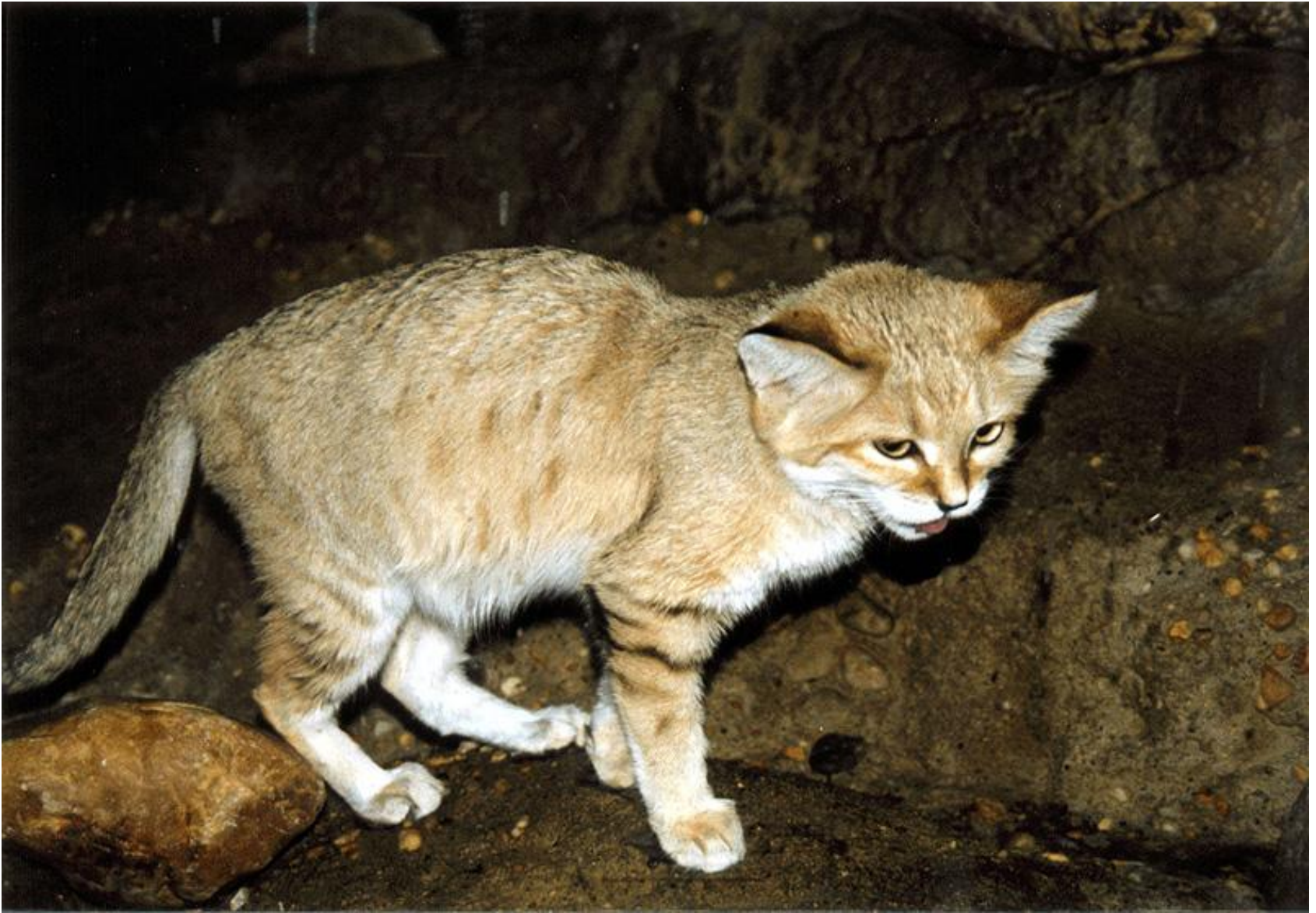
хаус (камышовый кот)