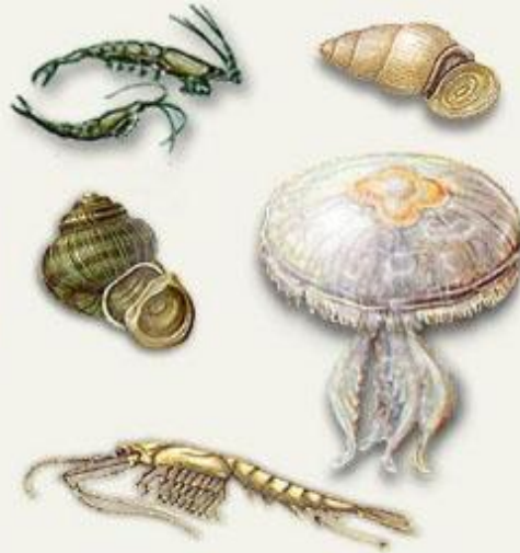
Животные, питающиеся фитопланктоном (медузы, моллюски, ракообразные)

С такими гигантами, о которых мы только что узнали, в морях и океанах спокойно соседствуют микроскопические водоросли. Они не опускаются на дно, но и не всплывают на поверхность, расположившись в толще воды. Все разнообразие этих водорослей-малышек объединяют общим названием фитопланктон (от греческих слов «фитон» - растение и «планктос» - блуждающий).