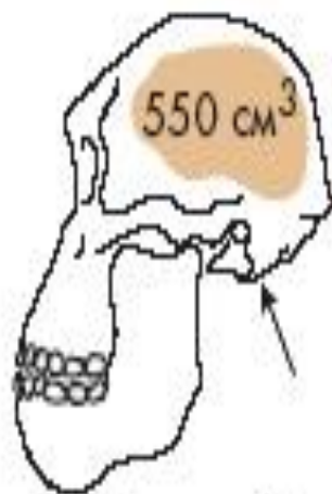
Australopithecus africanus (реконструкция)