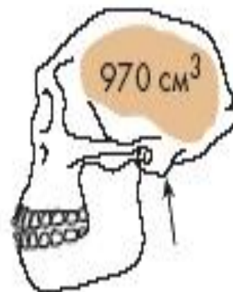
Homo erectus (реконструкция)