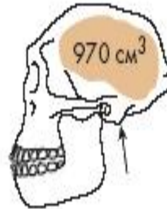
Homo erectus (реконструкция)