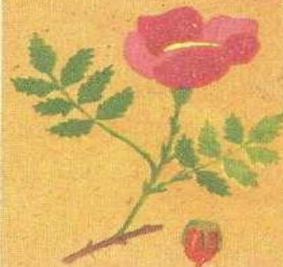
Покрытосеменные (цветковые) 200 000