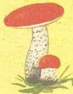
Грибы 70 000