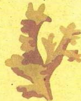
Лишайники 20 000