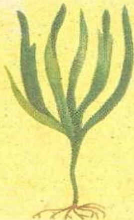
Водоросли 20 000