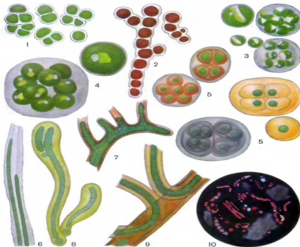
Т а б л и ц а 2. Наземные (1—9) и почвенные (10) водоросли:

1 — отдельная клетка и группы клеток плеврококка ( Pleurococcus vulgaris ); 2 — простые и ветвящиеся нити трентеполии ( Trentepohlia piceana ) с оранжевым маслом в клетках; 3 — отдельная клетка и размножение хлореллы ( Chlorella vulgaris ); 4 — группа молодых клеток и взрослая клетка хлорококка ( Chlorococcum haptocolla ); 5 — колонии глеокапы с различной окраской слизистых оболочек: желто-коричневой ( Gleocapsa leprestris ), красно-коричневой ( Gl. magma ) и сине-фиолетовой ( Gl. alpina ); 6 — участок таллома шизотрикса ( Schizothrix friesii ) с двумя трихомами в общем слизистом чехле; 7 — часть нити стигонемы ( Stigonema minutum ); 8 — нити толипотрикса ( Tolyrothrix elenkinii ); 9 — часть нити сцитонемы ( Scytonema mirabile ); 10 — общий вид пробы почвы в люминесцентном микроскопе: красным светятся живые клетки водорослей, содержащие хлорофилл.