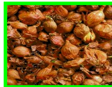
Лук - шалот