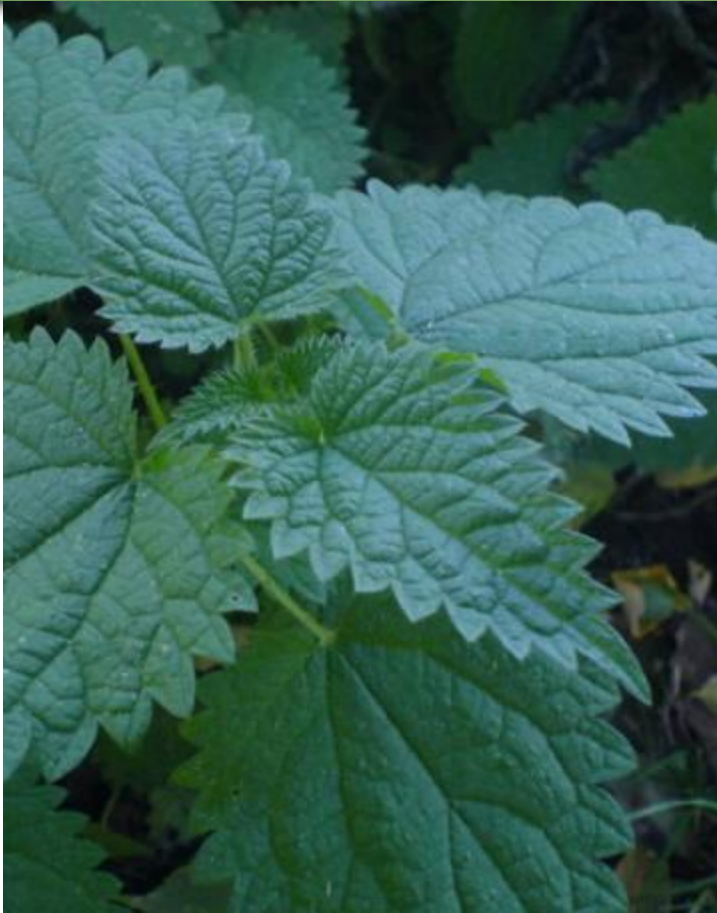
Обжигающие волоски крапивы