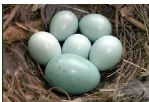
Горихвостка, яйцо кукушки в гнезде горихвостки

У открыто гнездящихся птиц самка, сидящая на гнезде почти неотличима от окружающего фона. Соответствует фону и пигментированная скорлупа яиц. Интересно, что у птиц, гнездящихся в дупле, на деревьях, самки нередко имеют яркую окраску, а скорлупа светлая.