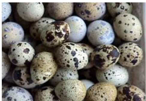
Перепел и его яйца