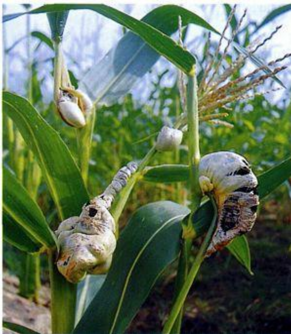
Початки кукурузы, пораженные головневым грибом