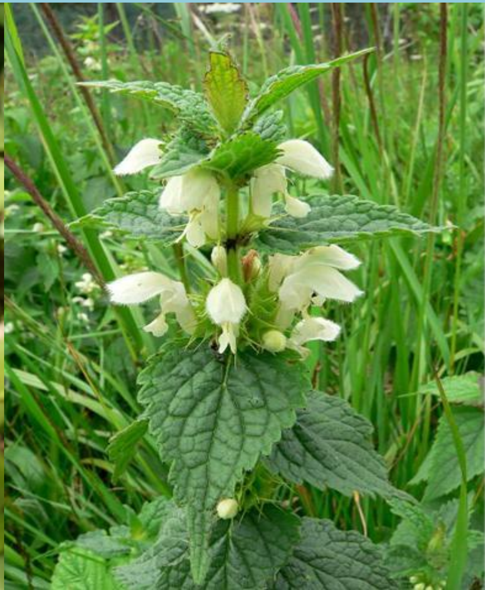
Живучка ползучая, яснотка белая.