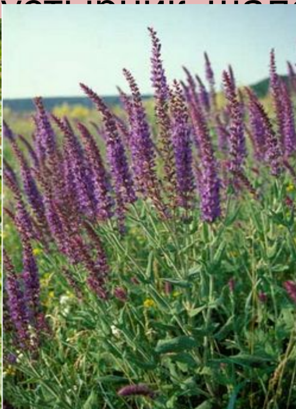
Шалфей ( Salvia ), род растений семейства губоцветных.