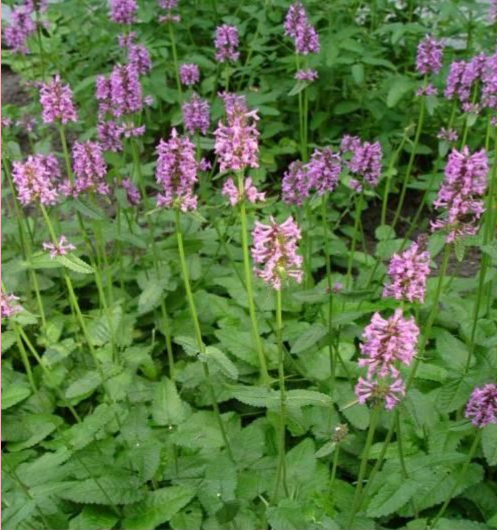
Lamiaceae - BETONICA OFFICINALIS - bukvice lékařská