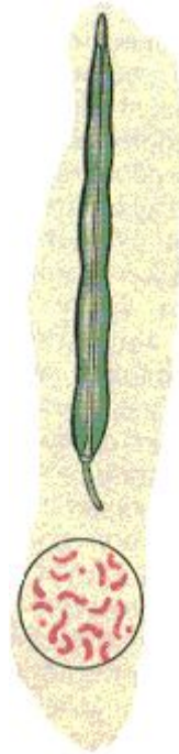
Диплоидный набор редьки 18 хромосом