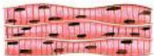
В. Мышечные ткани