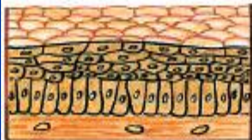
А. Эпителиальные ткани