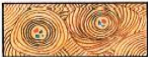
Б. Соединительные ткани