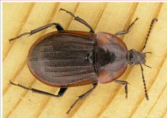
Мертвоед трёхрёберный, Phosphuga atrata