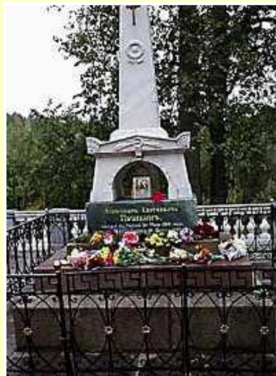
Могила А. С. Пушкина в наше время