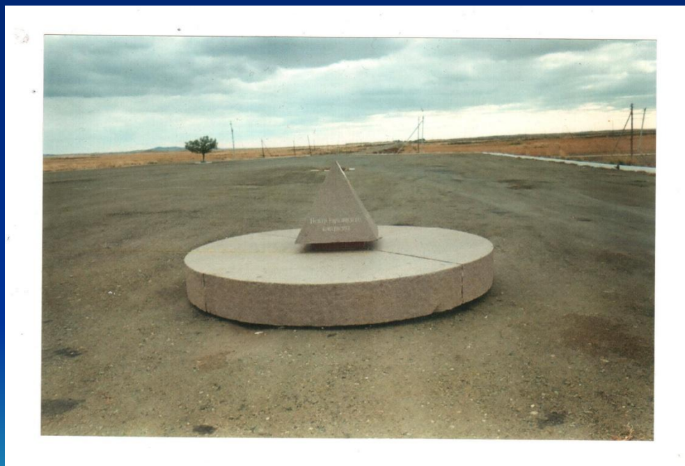
Памятный знак «Центр Евразийского континента» в урочище Жетыбай Восточно-Казахстанской области