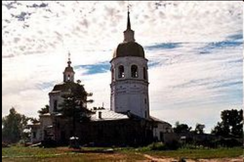
Церковь Преображения Спасителя, около 1750

Енисейск долгое время был культурным центром Енисейской губернии.