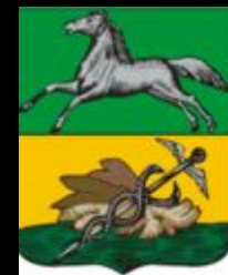
Герб 1804 года