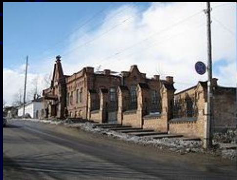
Аптека в Енисейске

Енисейск был крупным центром иконописного искусства. В 1669 году в городе работали пять иконописцев. В 1760 — 1780-х годах были известны енисейские иконописцы Григорий Кондаков и Максим Протапопов.