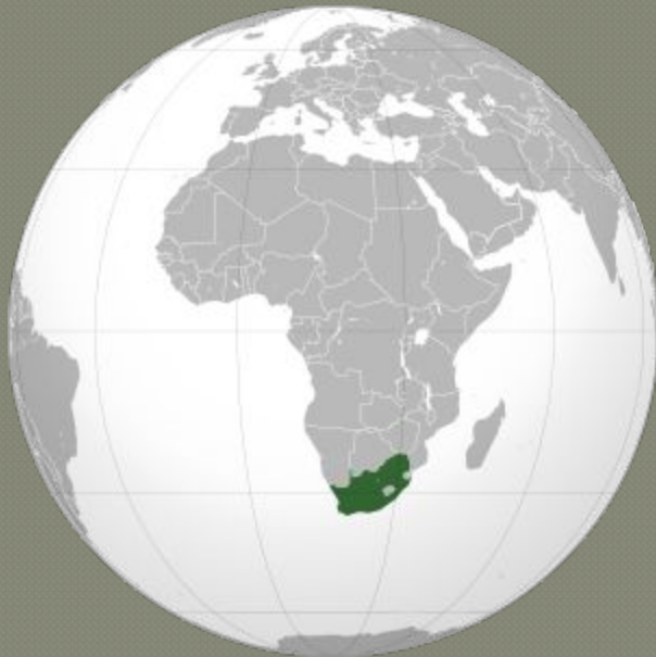
ЮАР на карте мира