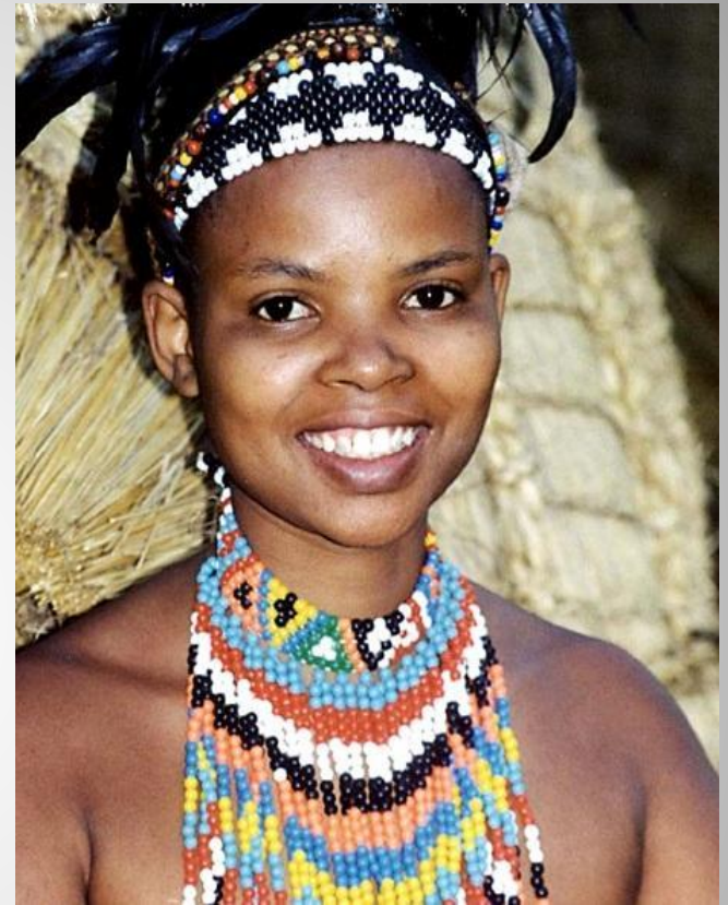
Девочка из племени Зулусу