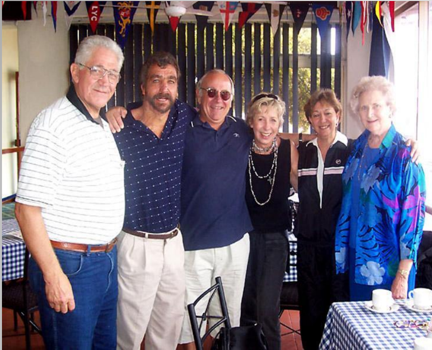
БУРЫ – потомки голландских переселенцев