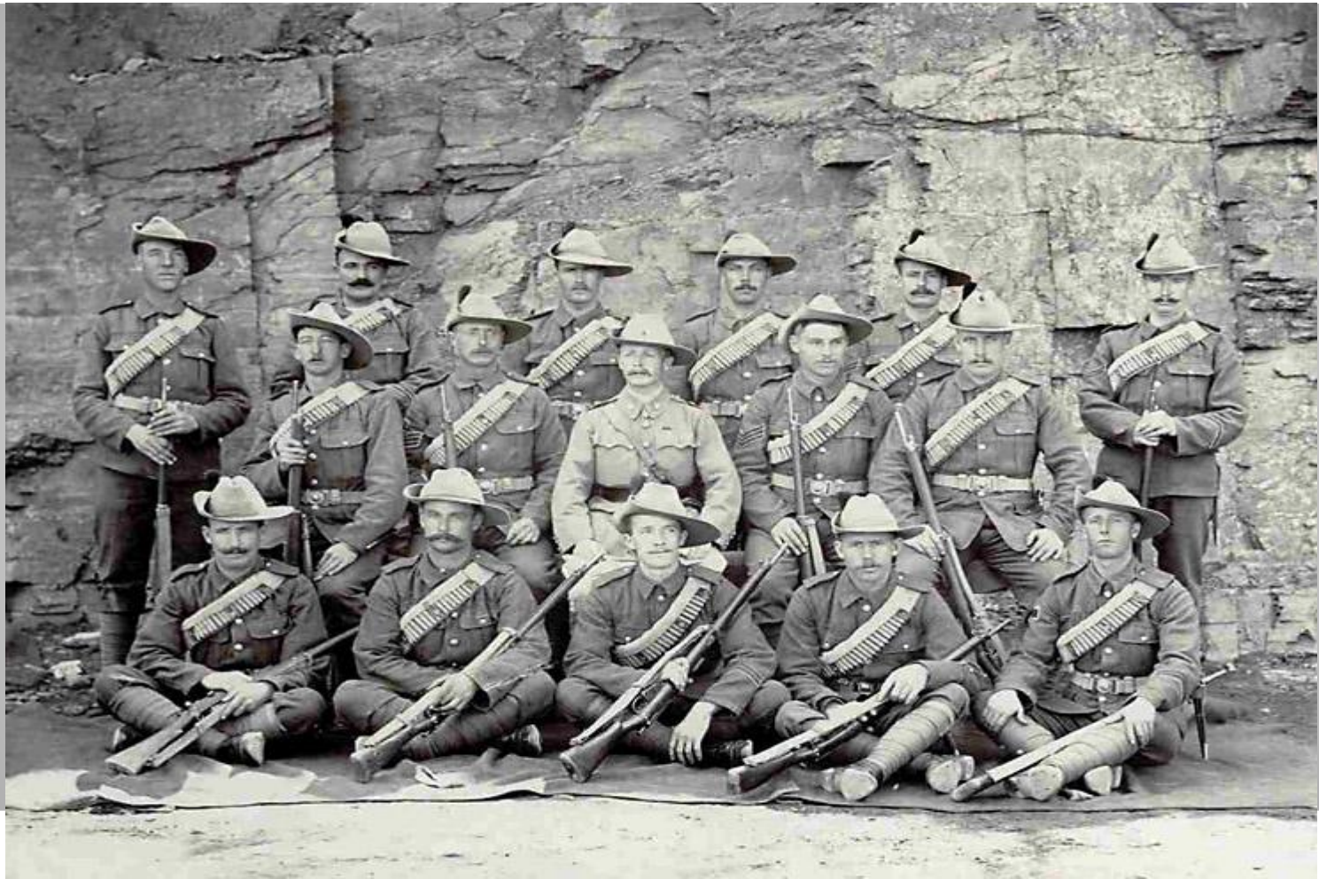
Бурские солдаты – 1902 год