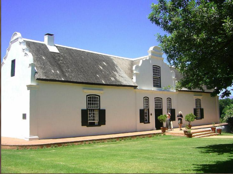
ФЕРМА В ЮАР, ПРИНАДЛЕЖАЩАЯ БЕЛОМУ ФЕРМЕРУ