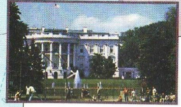
Белый дом — резиденция президента США в Вашингтоне