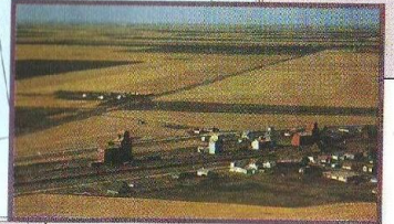
Типичный пейзаж в «пшеничном поясе» США