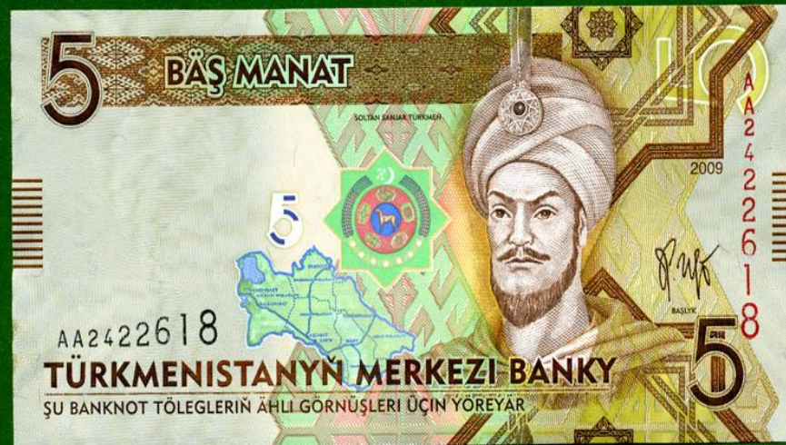
Манат - денежная единица Туркмении