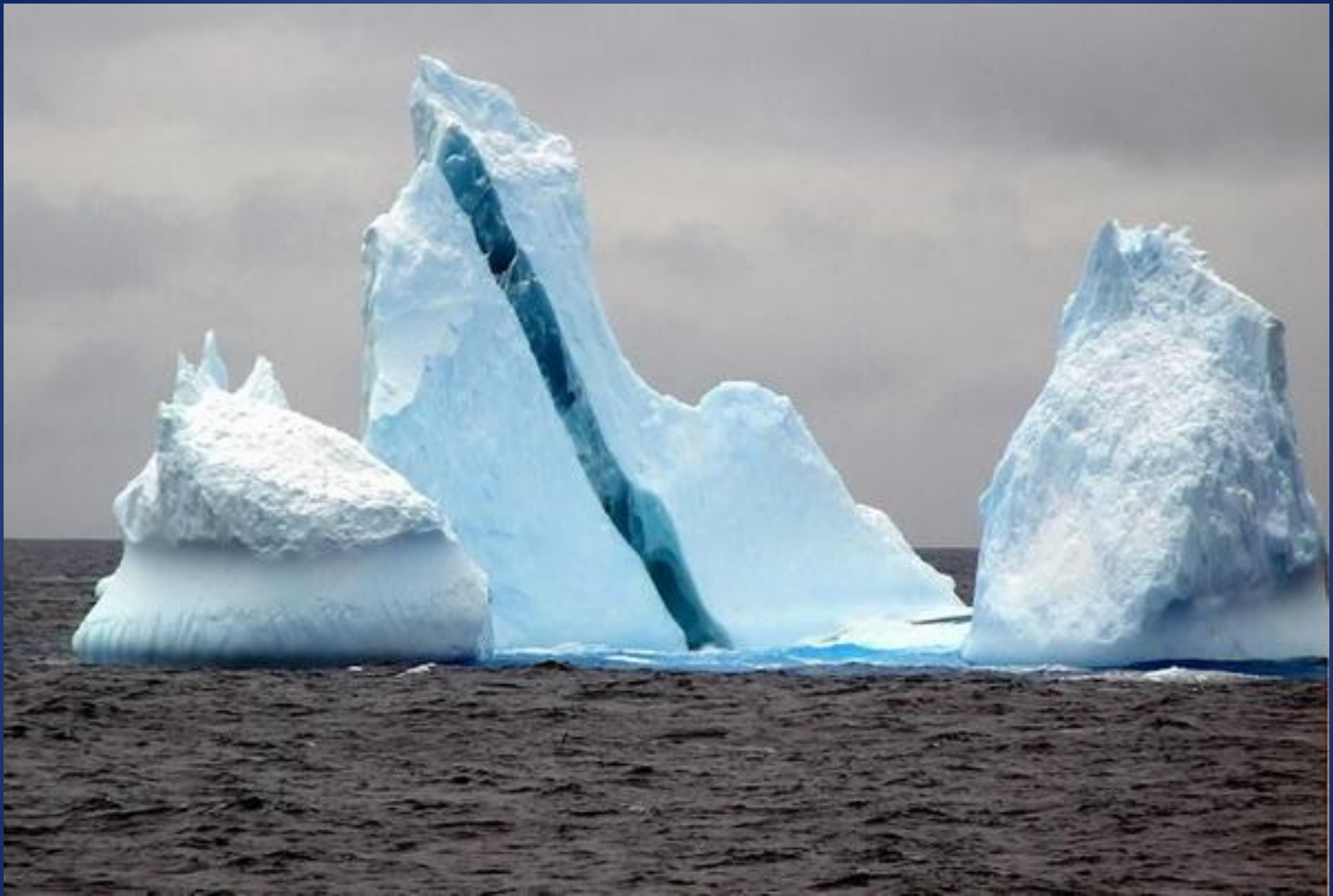
Айсберг с прослойкой из голубого льда.