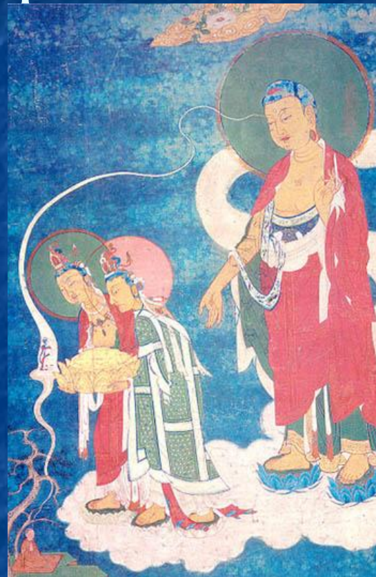
Встреча Буддой умершего праведника