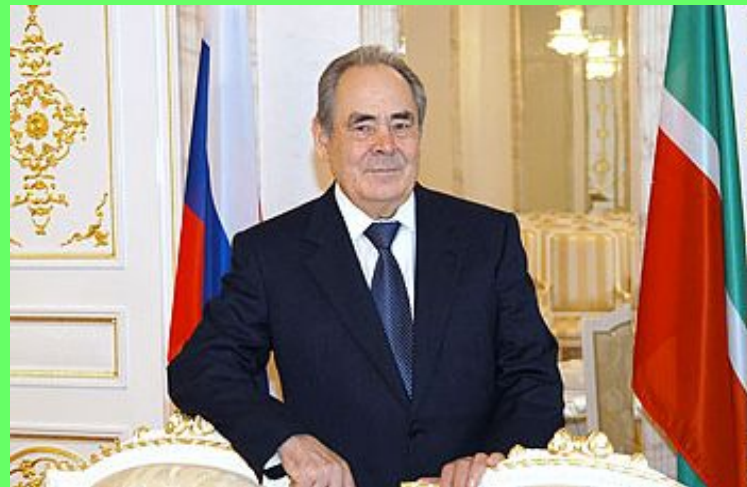
Минтимер Шәрип улы Шәймиев.

Татарстанның беренче Президенты – Минтимер Шәрип улы Шәймиев.