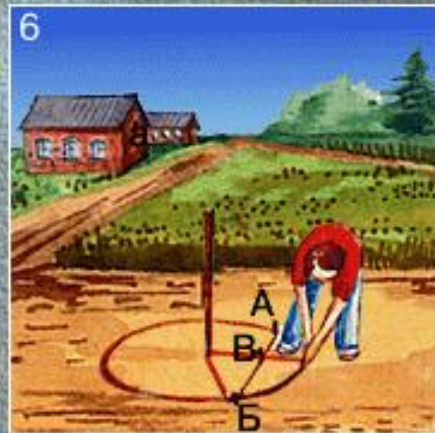
ОРИЕНТИРОВАНИЕ С ПОМОЩЬЮ ГНОМОНА