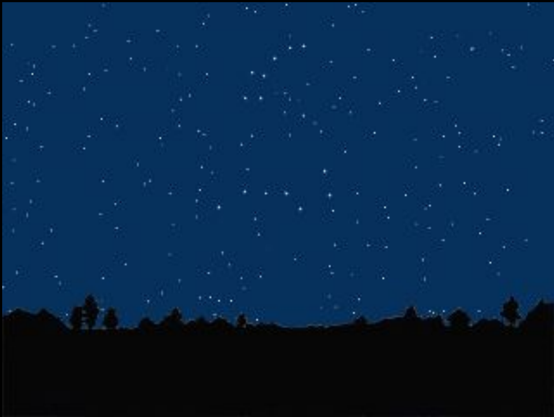
Ориентирование по звездам