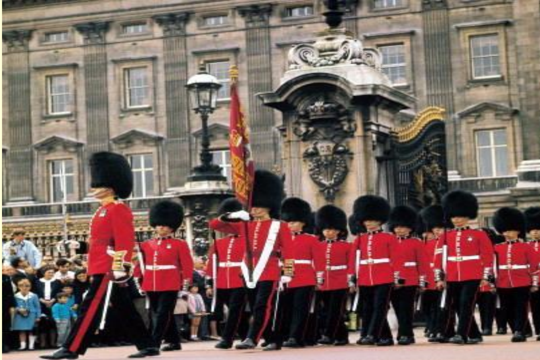
Королевская гвардия. Смена караула