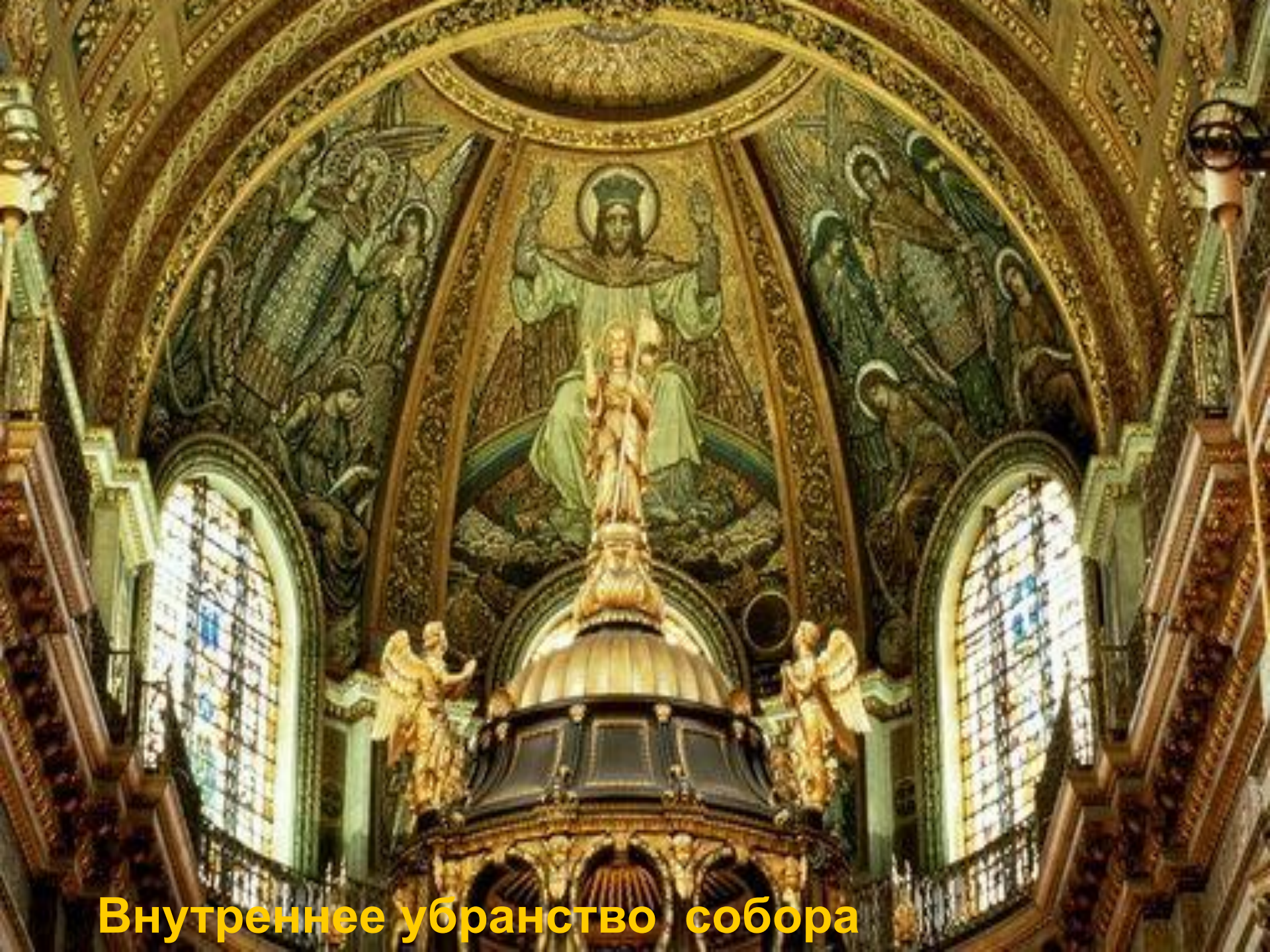
Внутреннее убранство собора