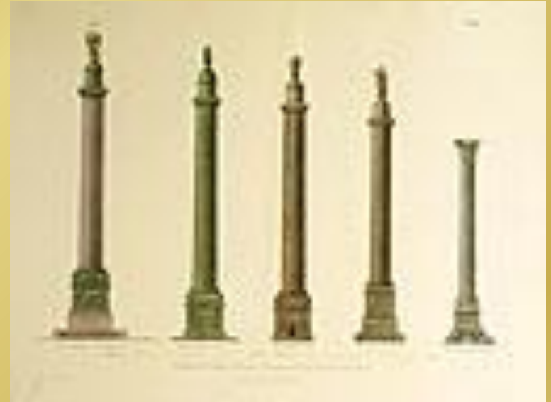
Сравнение Александровской колонны, колонны Траяна, колонны Наполеона, колонны Марка Аврелия, и так называемой "колонны Помпея"