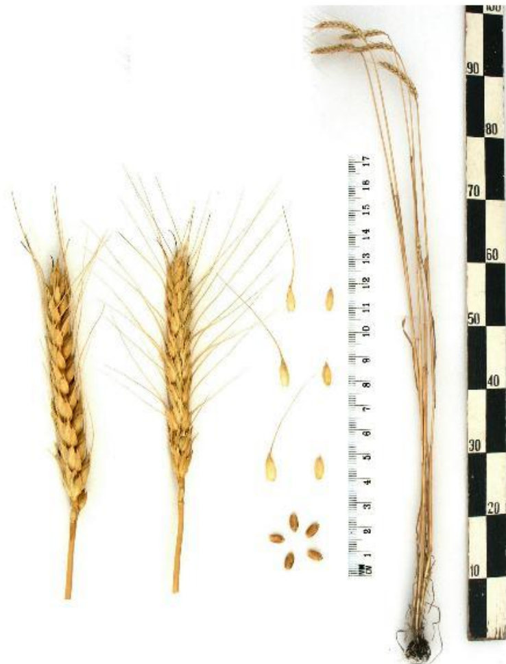
Озимая Мягкая пшеница КД Альянс