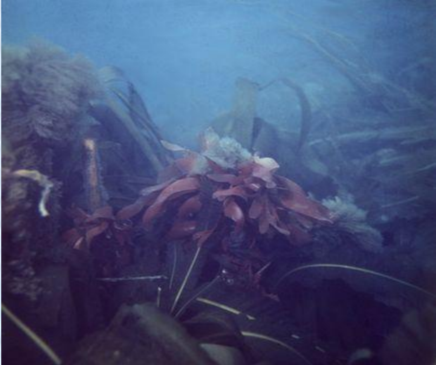
Пояс ламинариевых водорослей с эпифитами из красных водорослей