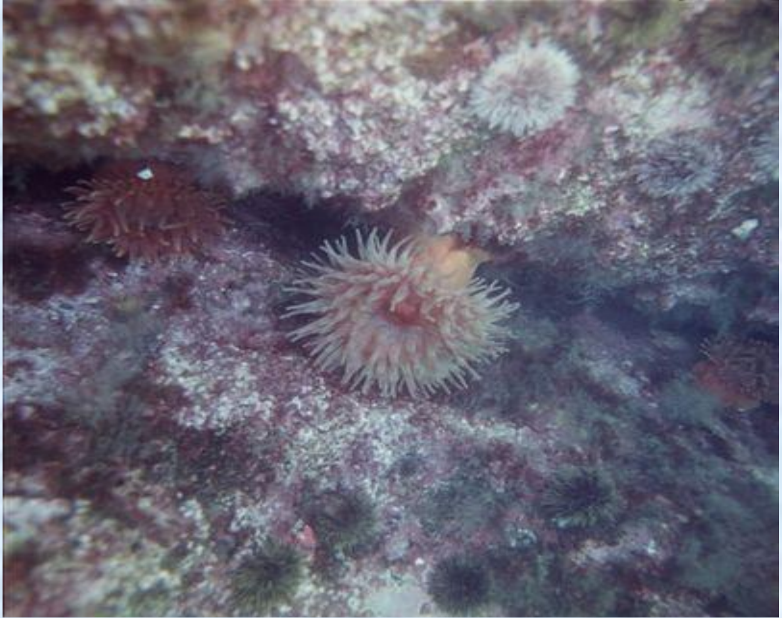
Зелёные и багряные водоросли