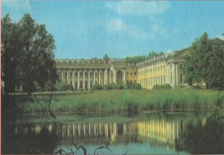
Александровский дворец. Архитекторы: Дж. Кваренги и В. П. Стасов.