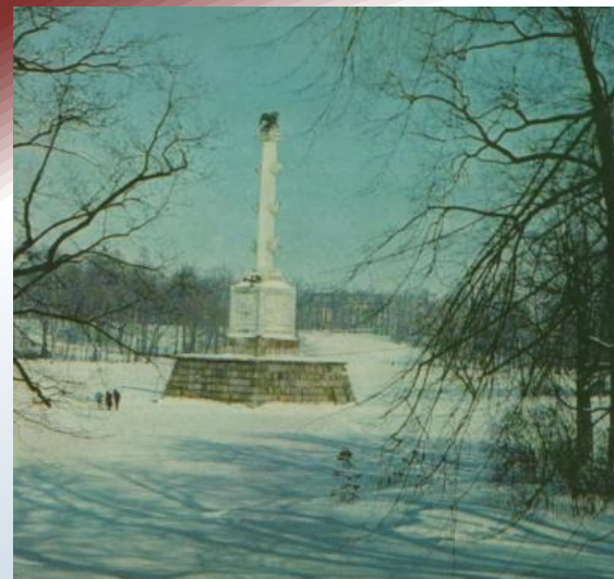
Екатерининский парк. Чесменская колонна. Архитектор А. Ринальди. 1776г.

Грандиозные, торжественно-праздничные здания в стиле развитого русского барокко, с богатыми пластичными убранствами фасадов и интерьеров.