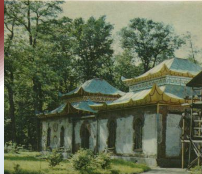
Александровский парк. Китайская деревня. Архитекторы: А. Ринальди, В. Неелов. 1782-1798