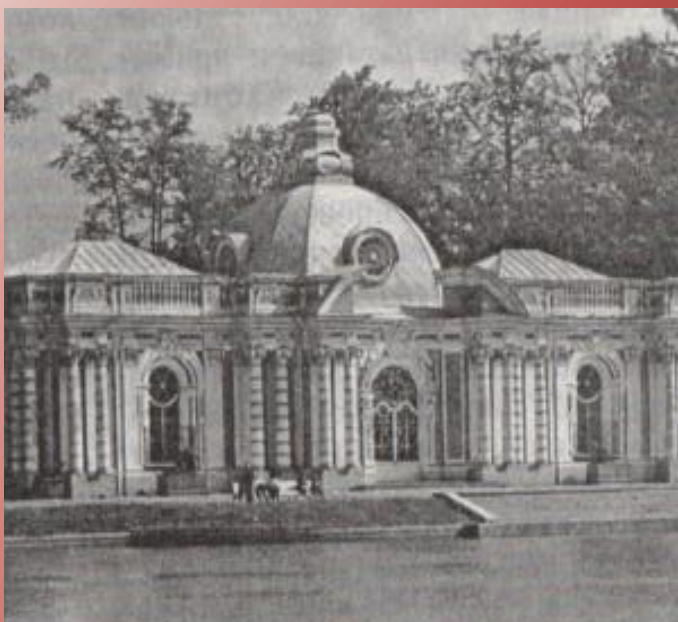
Павильон Грот. Архитектор: Растрелли. 1749-1761.