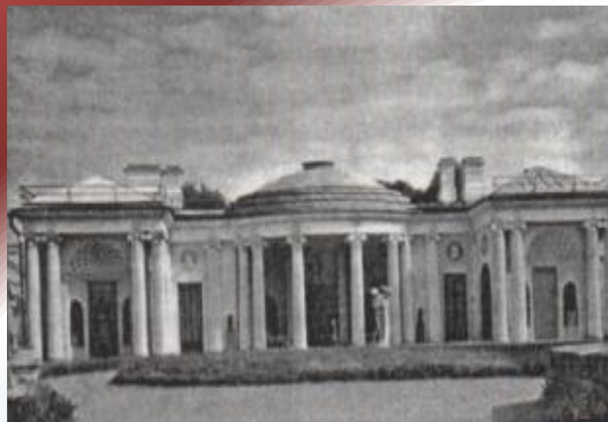
Павильон «Агатовые комнаты»