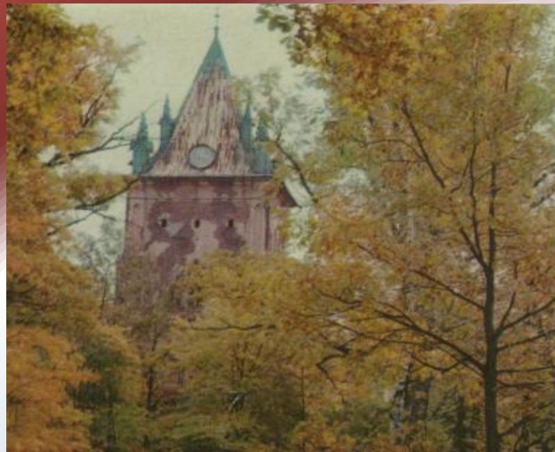
Александровский парк. Шапель. Архитектор: А. Менелас, 1825-1828.