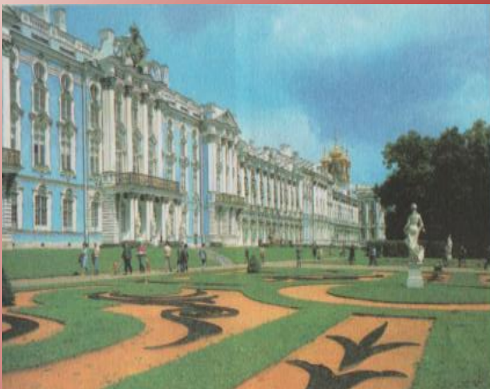
Большой(Екатерининский) дворец. Архитекторы: С.И. Чеванский, В.В. Растрелли, А.В. Квасов.

Грандиозные, торжественно-праздничные здания в стиле развитого русского барокко, с богатыми пластичными убранствами фасадов и интерьеров.