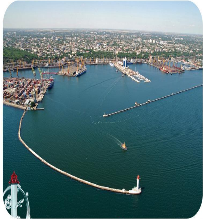
Одесса с высоты птичьего полета Odessa from the bird's-eye view

Рассказать об Одессе - задача достаточно сложная. Немного найдется в мире городов, которые за столь короткий срок своего существования (чуть более двухсот лет) приобрели бы мировую известность. Одессе суждено было родиться у моря.