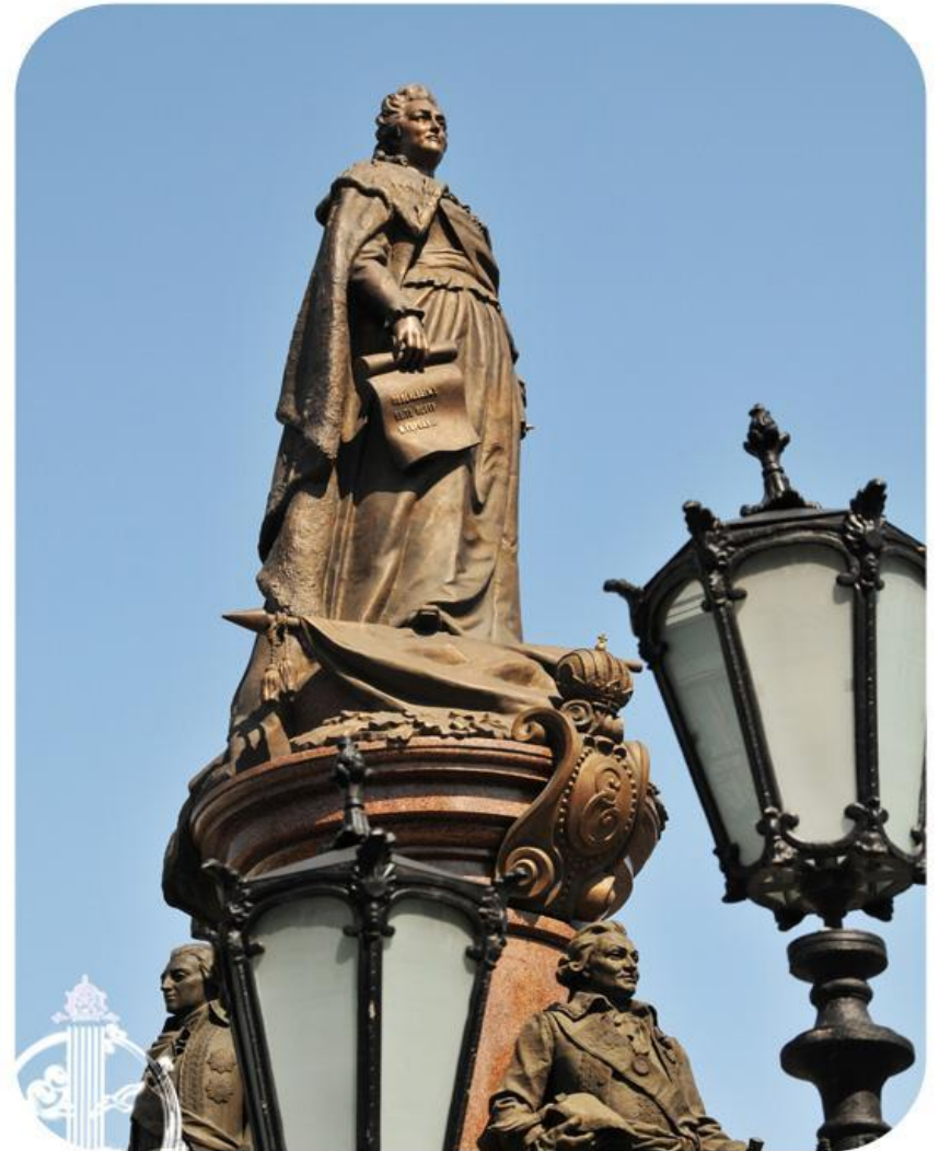
Памятник основателям Одессы Monument to the Founders of Odessa

2 сентября 1794 года и является днем рождения города Одессы.