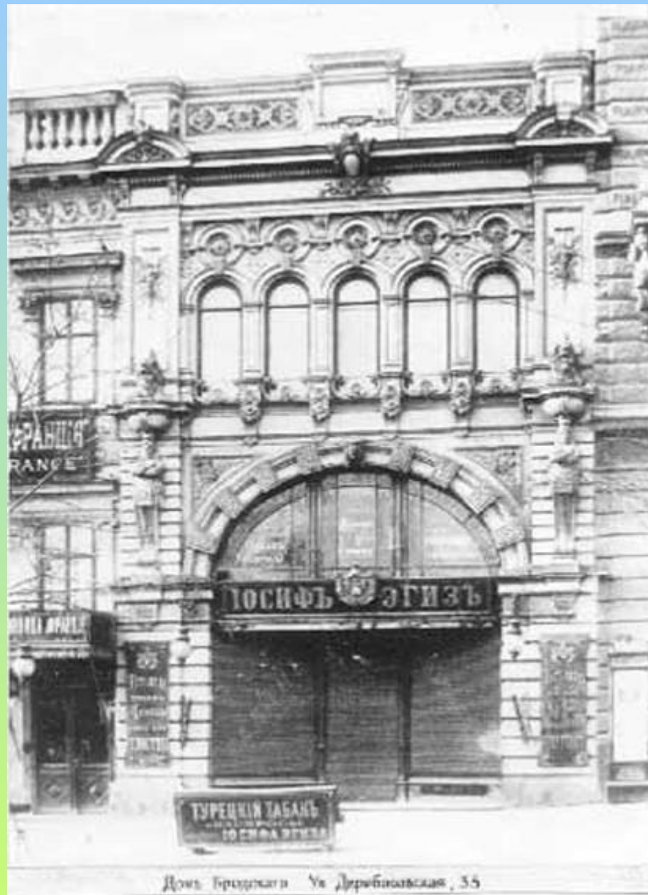
Домъ Грещекаго Ул. Дерибасовская, 55

Улица Дерибасовская - любимая улица одесситов, с этой улицей связаны многие незабываемые страницы истории города.