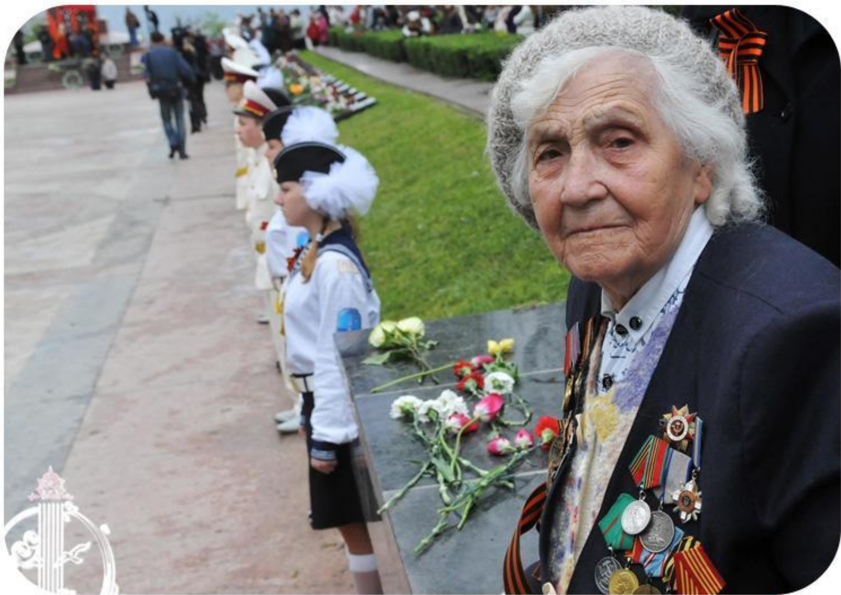
Слава Героям Glory to Heroes