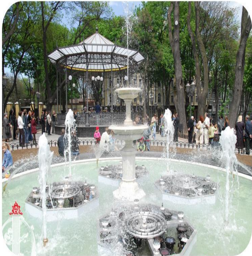
Фонтан в Городском саду Fountain in the City Garden