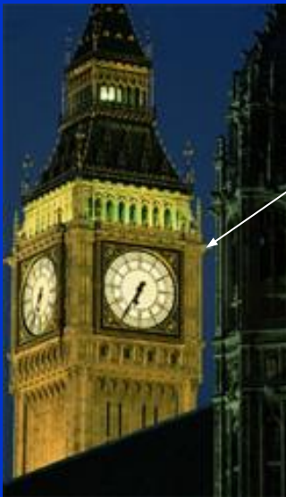
3. Биг Бен