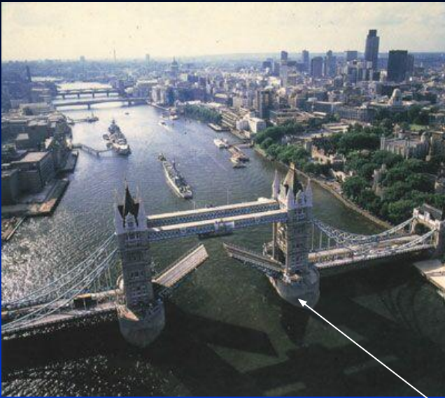
1. Тауэрский мост