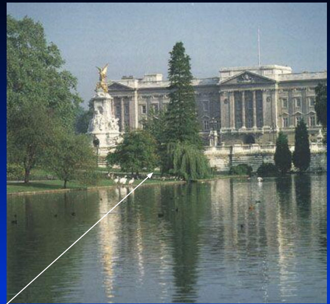
2. Букингемский дворец