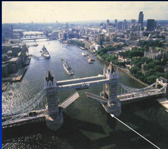
1. Тауэрский мост