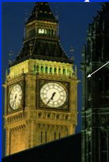
3. Биг Бен