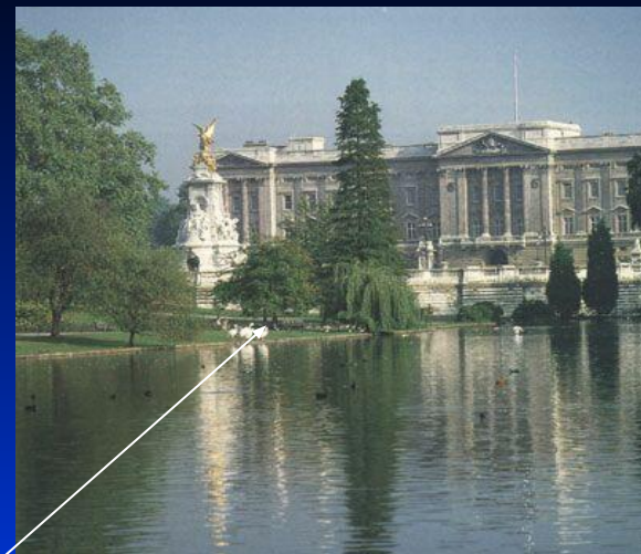
2. Букингемский дворец