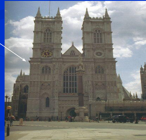
4. Вестминстерское аббатство