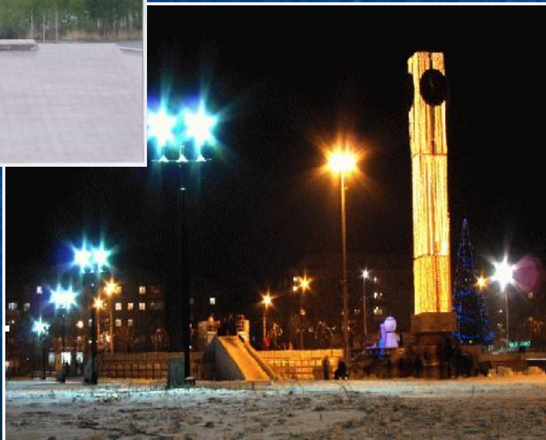
Вторая - площадь Народных гуляний