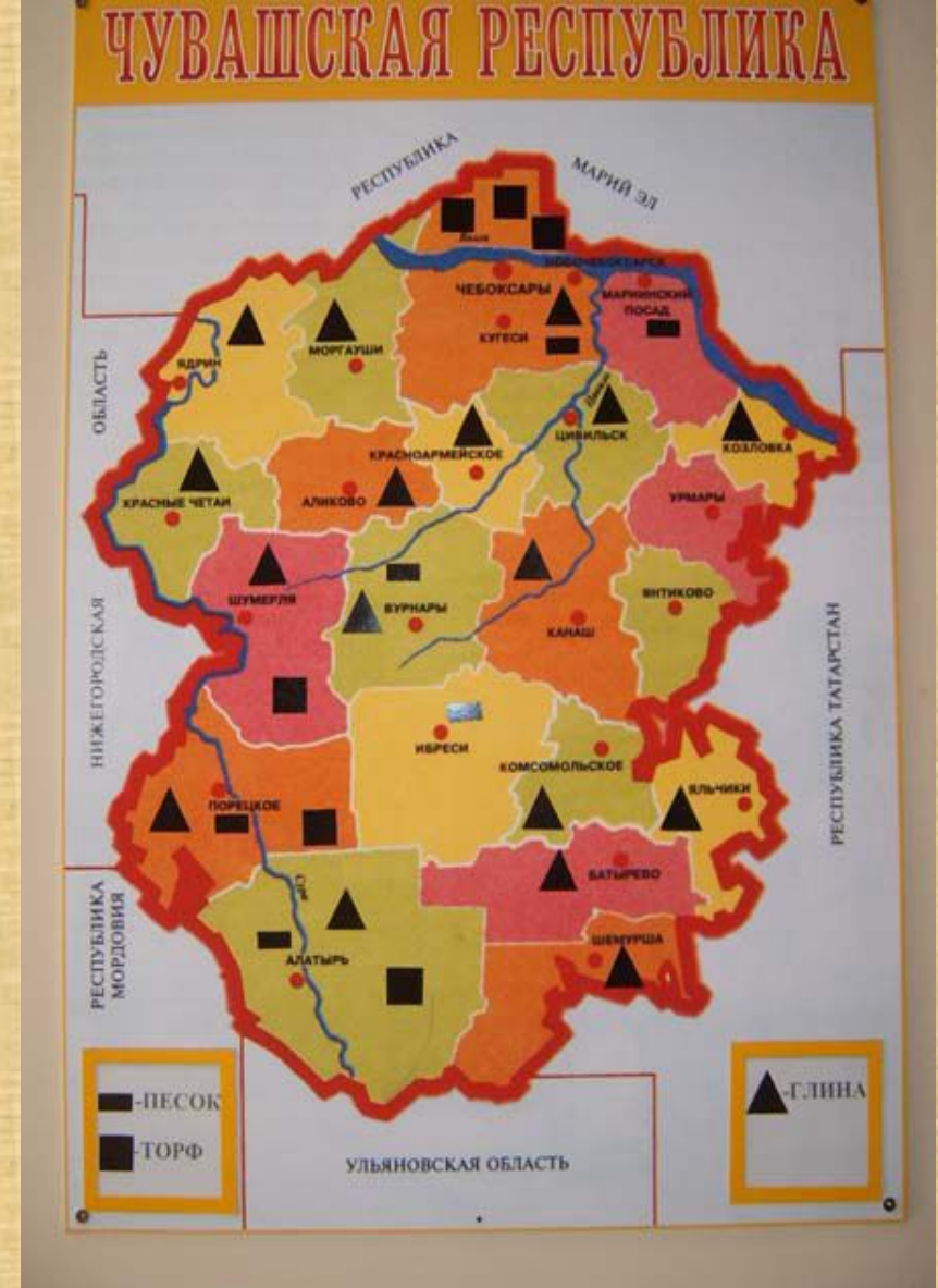
Биологическая карта Чувашии Полезные ископаемые Чувашии